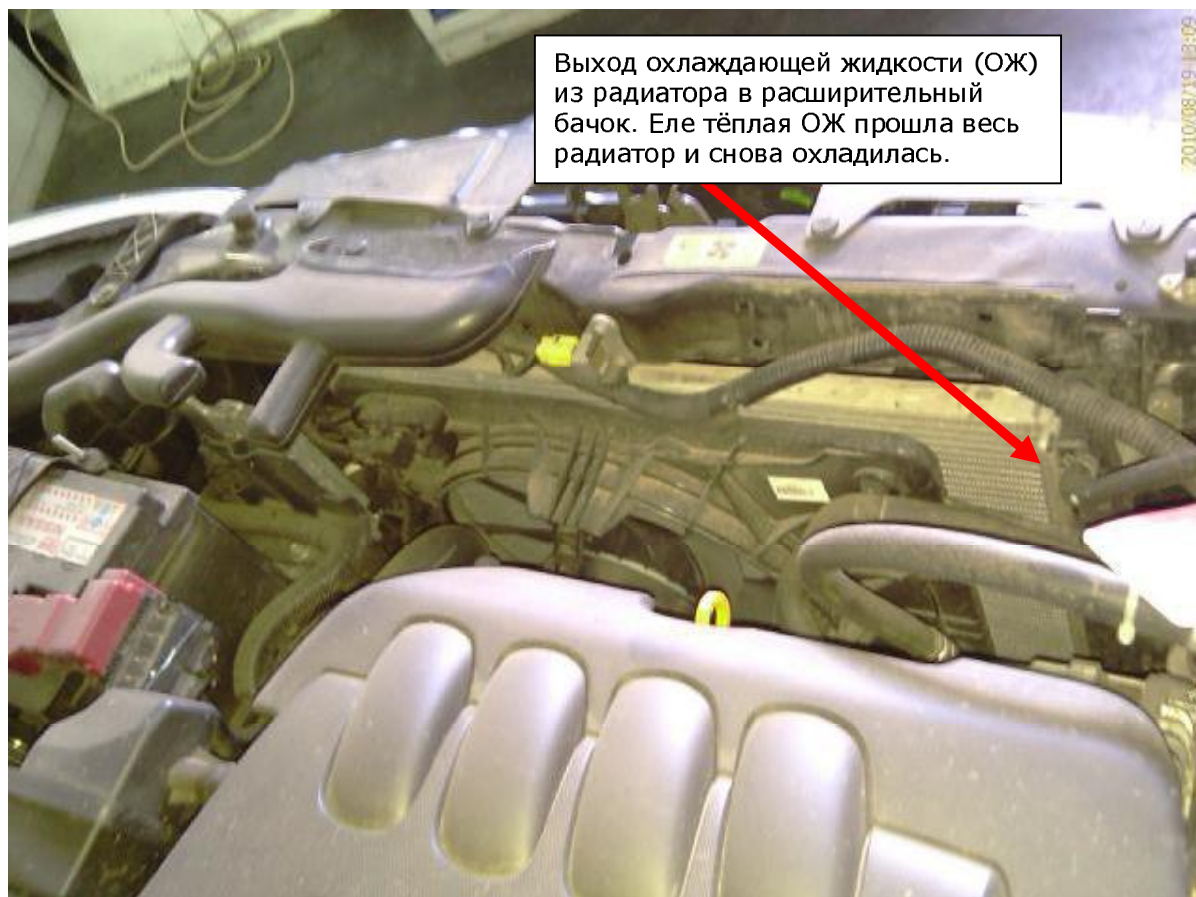
Фото для «нового» 2.0 CVT